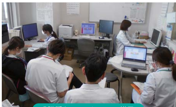
多職種カンファレンスの様子

今後も患者さん個々の状況に合わせた最善のケアを促進できるよう多職種協働で取り組んでまいります。